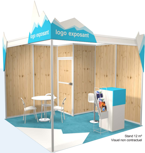
Stand 12 m 2 Visuel non contractuel