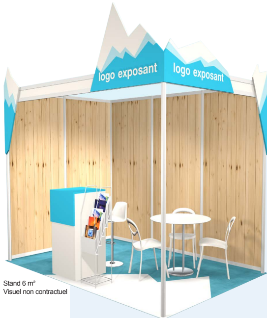
Stand 6 m 2 Visuel non contractuel